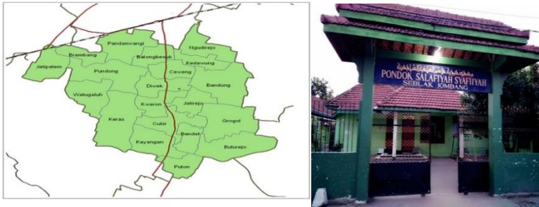
Gambar 4.1: Peta Letak Pesantren dan Gerbang depan Pesantren Seblak Jombang 80

Pesantren Seblak didirikan pada tahun 1921 di sekitar 300 meter ke arah barat dari Pesantren Tebuireng, berlokasi di dusun Seblak Kwaron, Kecamatan Diwek, Kabupaten Jombang. 79 Pendirian pesantren tersebut merupakan saran dari Kiai Hasyim Asy'ari kepada Kiai Maksum Ali dan Nyai Khoiriyah Hasyim untuk mengelola dan mengembangkan ilmunya di wilayah Dusun Seblak dan sekitarnya.